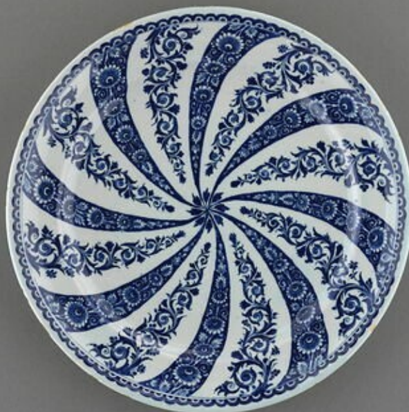
Assiette à décor rayonnant (Manufacture de Rouen, fin XVII e )