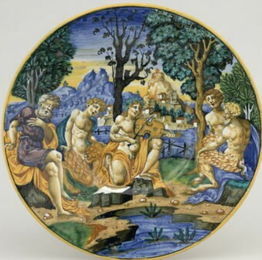
Assiette avec Apollon et Pan (Italie XVI e )