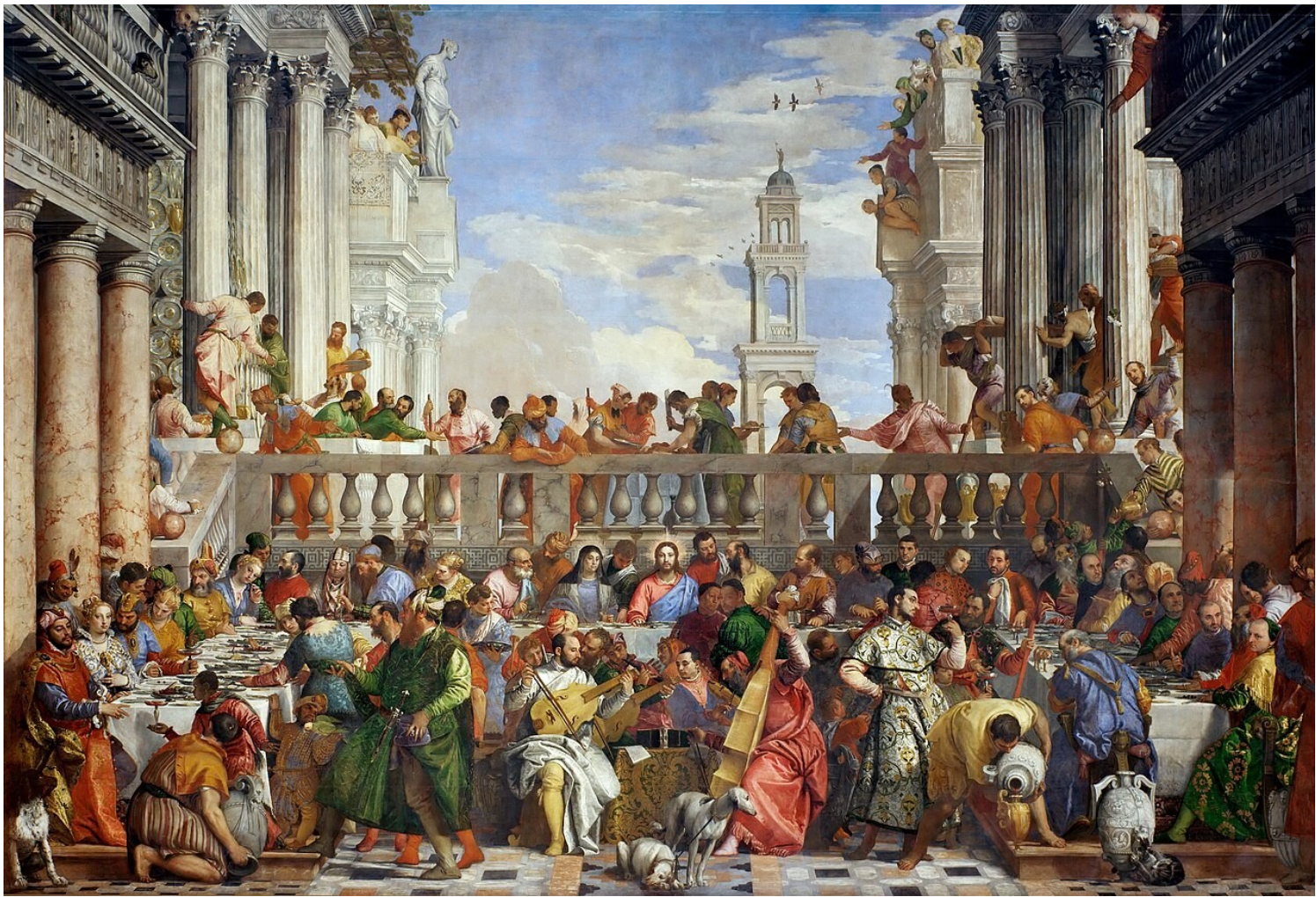
« Les Noces de Cana », Veronese (1500-1600) https://collections.louvre.fr/ark:/53355/cl010064382