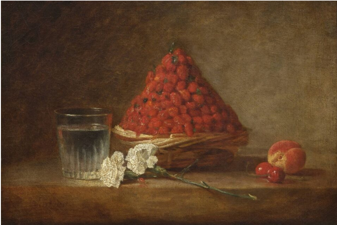
« Le panier aux fraises des bois », J-S Chardin, 1761.

Jusqu'au 28 février 2024, le Musée lance un appel au mécénat afin d'acquérir cette toile.