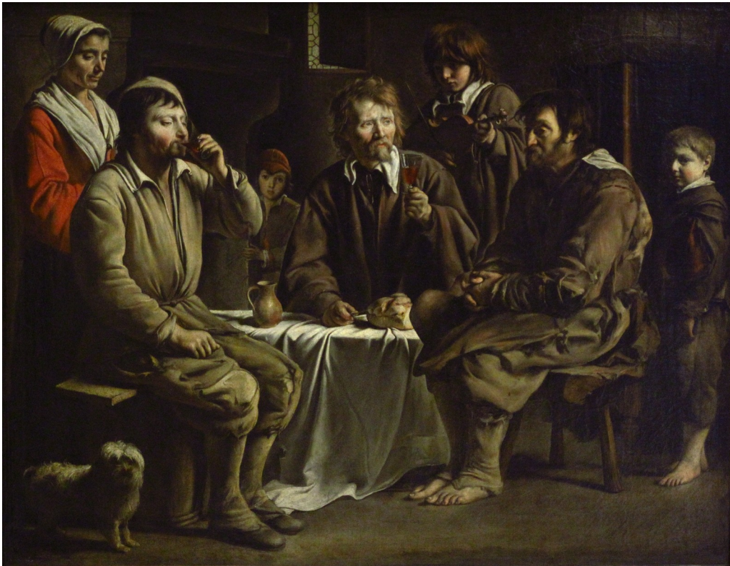
« Repas de paysans », Louis ou Antoine Le Nain, 1642

https://collections.louvre.fr/ark:/53355/cl010059565