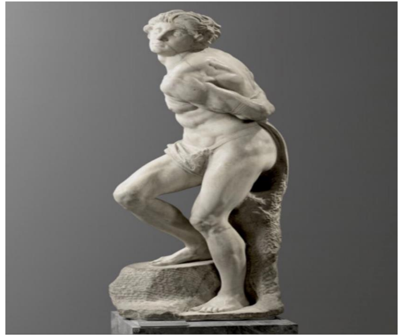
L'Esclave Rebelle de Michel-Ange, Musée du Louvre