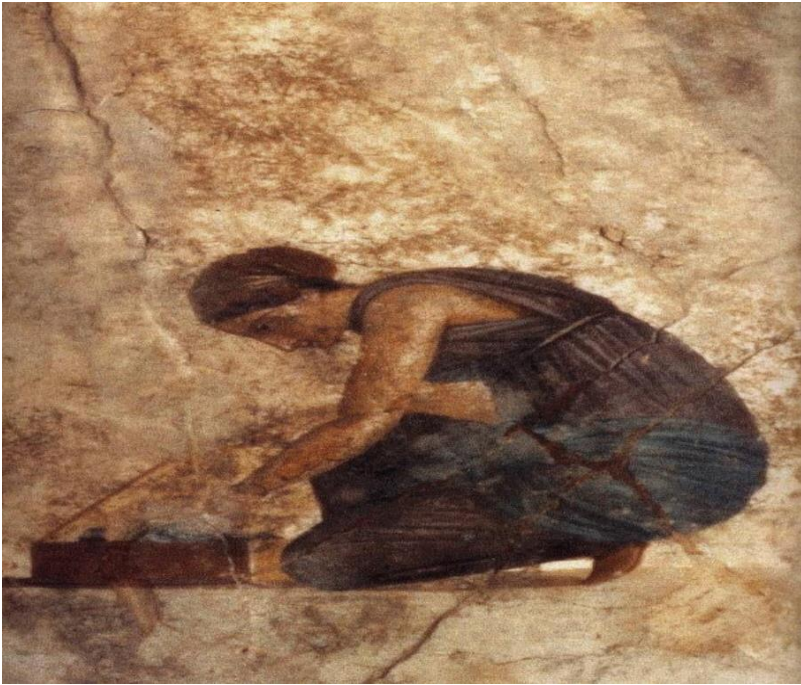
Servante préparant la toilette d'Aphrodite, Pompei, Maison de l'Amour Puni