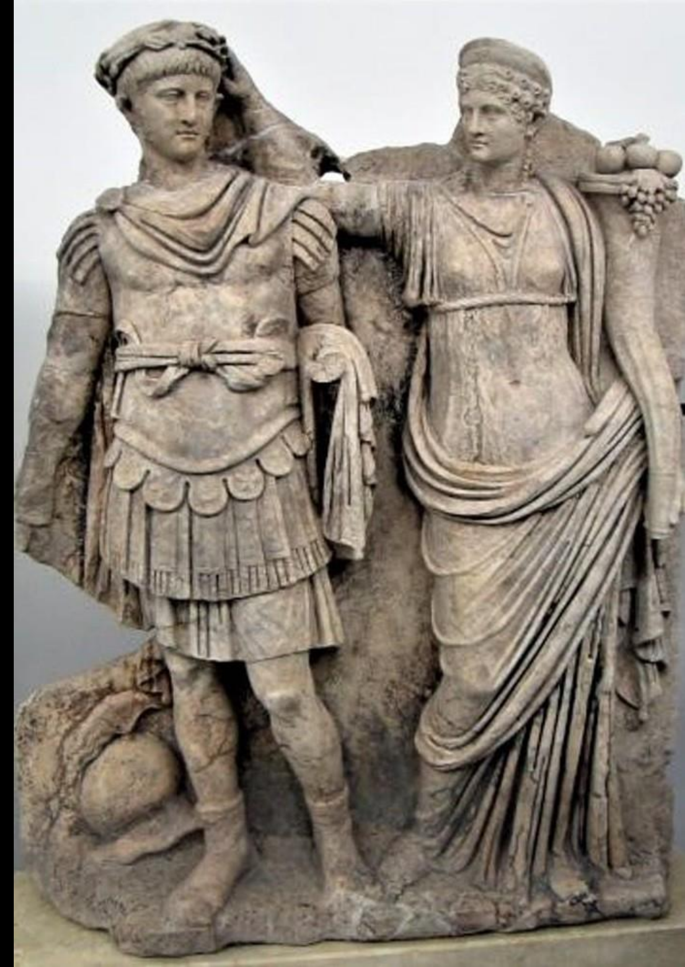
Néron couronné par sa mère Agrippine. Sculpture découverte à Aphrodisias, Turquie.