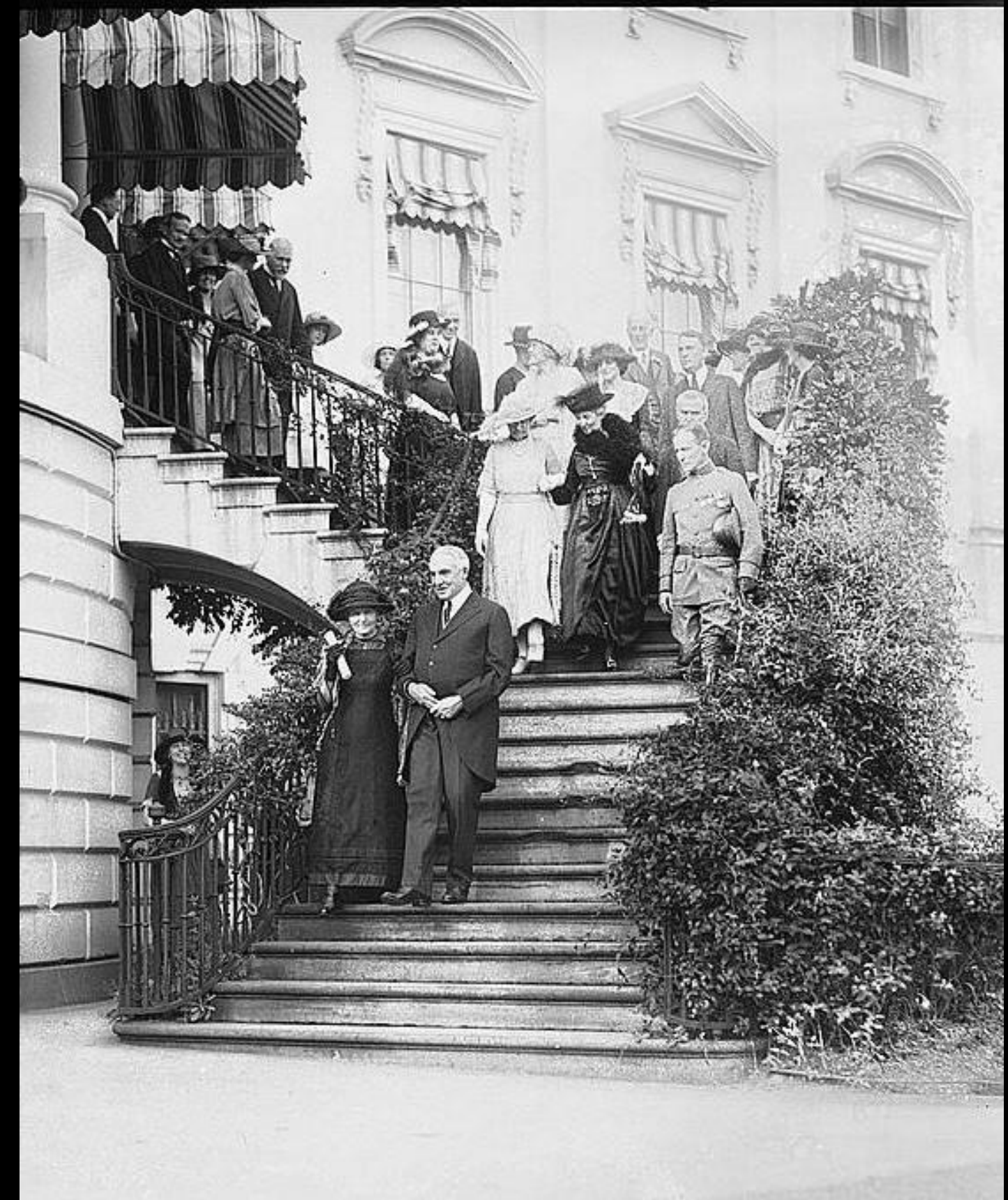
Marie Curie avec le Président des Etats-Unis, Warren G. Harding, à la tête du cortège descendant l'escalier de la Maison Blanche après la cérémonie, le 20 mai 1921.