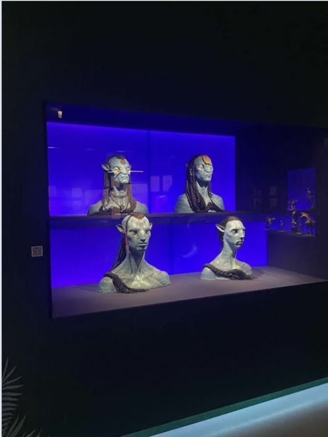
Photo prise dans la cinémathèque de Paris sur l'expédition sur James CAMERON (AVATAR)

Nous pouvons voir que Cameron utilise des technologies de pointe pour donner vie à ses visions, comme en témoigne l'un de ses films qui a connu un énorme succès, Avatar, où il crée la planète Pandora. C'est un lieu d'une beauté stupéfiante, peuplé de créatures extraordinaires. Cette immersion dans des univers fantastiques permet au public de s'échapper de la réalité, mais elle sert également de miroir pour réfléchir sur des enjeux existant dans notre société, tels que la préservation de l'environnement (protection de la biodiversité et des ressources naturelles), et la coexistence culturelle (en valorisant l'importance de vivre dans un monde avec différentes cultures, dans la paix mais aussi avec une ouverture d'esprit).