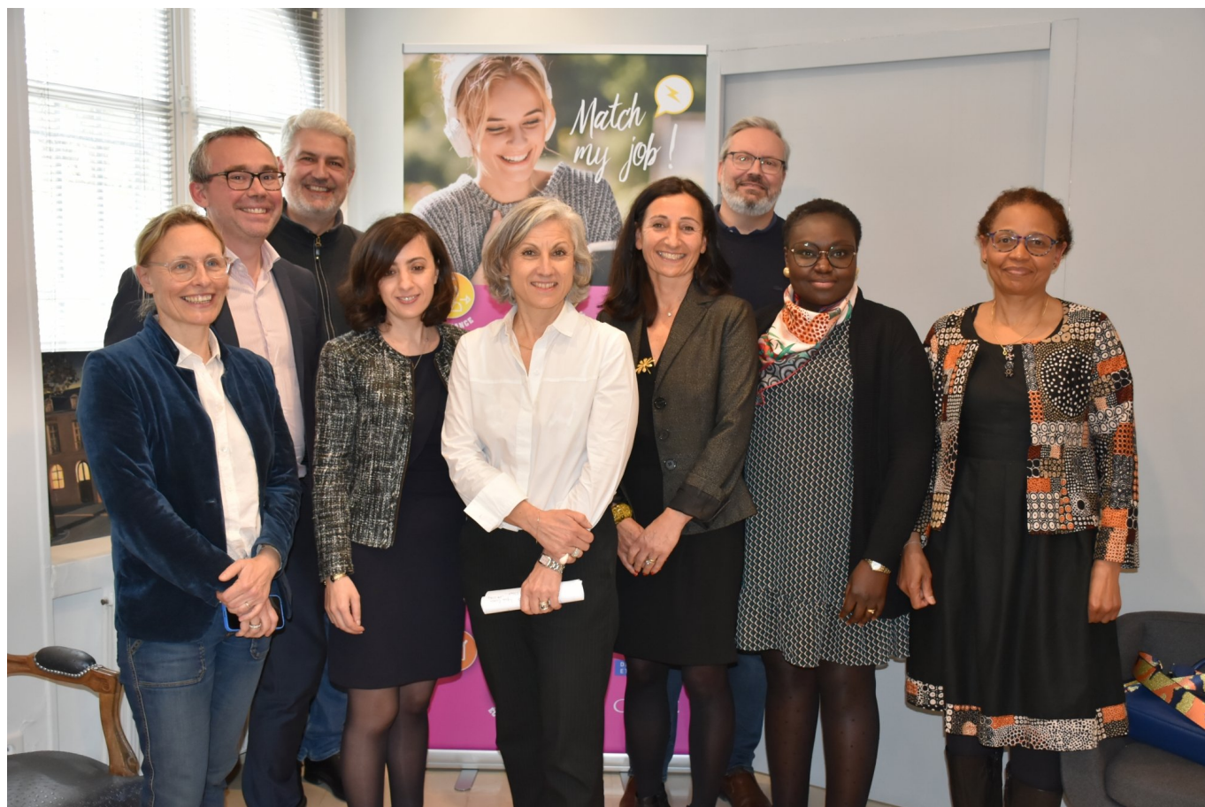
© Le jury, accompagné du 1er vice-président et du président de la CRCC.